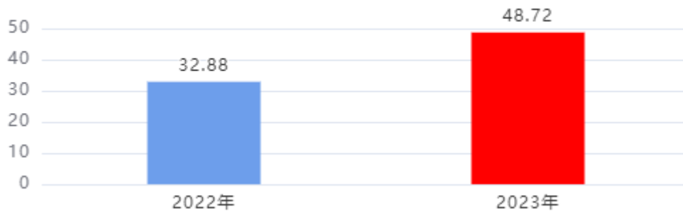
收入、支出决算总计对比图 (单位: 万元)