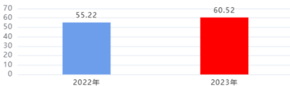
收入、支出决算总计对比图 (单位：万元)

2023年度收入总计、支出总计均为60.52万元，与上年相比收入总计、支出总计均增加5.30万元，增长9.60%，增长的主要原因是：本年度人员工资基数增加，相应的各类保险缴费基数增加。