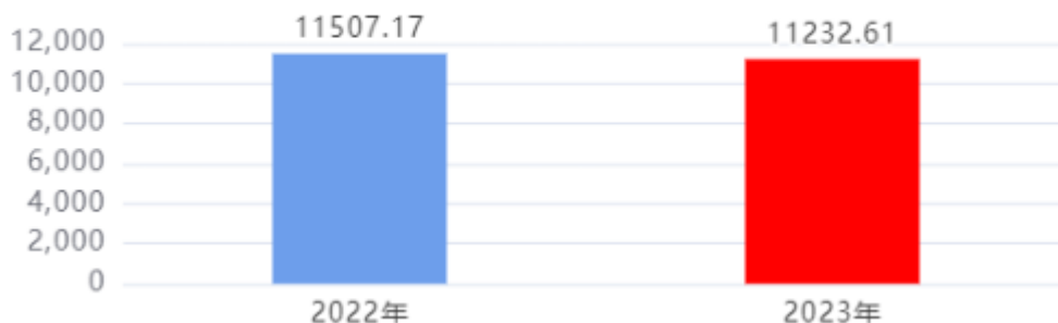
财政拨款收入、支出总计对比图 (单位：万元)

2023年度财政拨款收入总计、支出总计均为11,232.61万元，与上年相比收入总计、支出总计均减少274.56万元，下降2.39%，下降的主要原因是：单位内部人员变动，一人退休，一人调出。